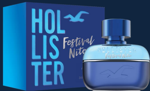
100 ml EDT