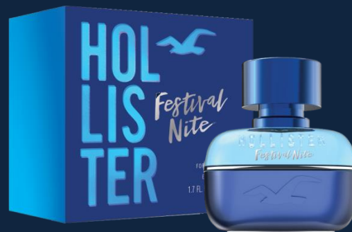
50 ml EDT